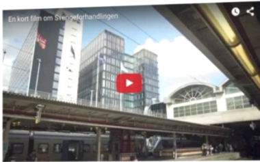
En kort film om Sverigeförhandlingen

VI FÖRHANDLAR OM FRAMTIDENS JÄRNVAGSNÄT OCH KOLLEKTIVTRAFIK I STORSTÄDERNA FÖR FLER BOSTÄDER. BÄTTRE ARBETSMARKNAD OCH ETT HÅLLBART RESANDE