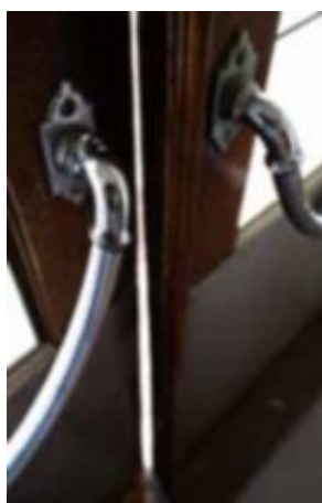
Ett gammalt handtag har bevarats på dörren ut mot terrassen.