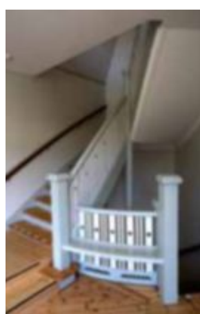
I trapphuset är de gamla trappräckena kvar och ljugarbänken kan ge upphov till ett och annat samtal.