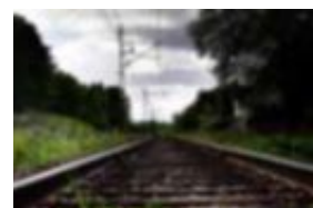
Under 2016 och 2017 kommer Sverigeförhandlingen att genomföras. Då bestäms bland annat Götalandsbanans sträckning genom Ulricehamn.

Nästa år drar den stora Sverigeförhandlingen igång. Beroende på vad beslutet till slut blir kan det innebära nya bostadsområden i Ulricehamn.