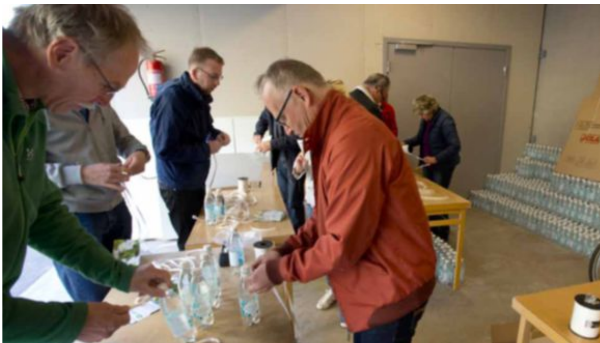
För andra året i rad ska polisens volontärer dela ut vattenflaskor vid studenten.

- Vad vi känner till så finns det ingen annan kommun i