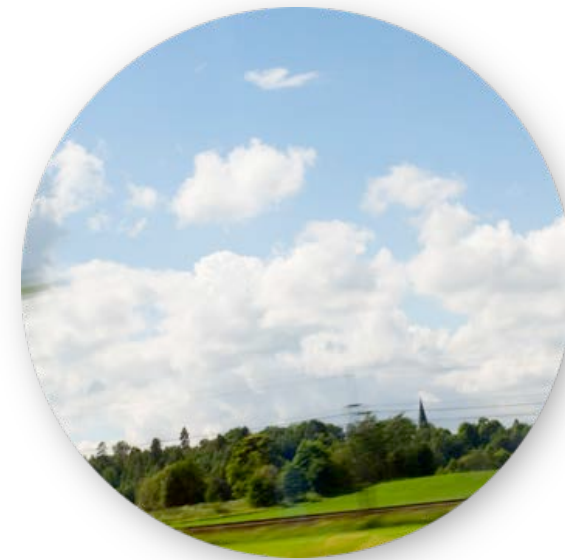
JÄRNVÄG I NORR